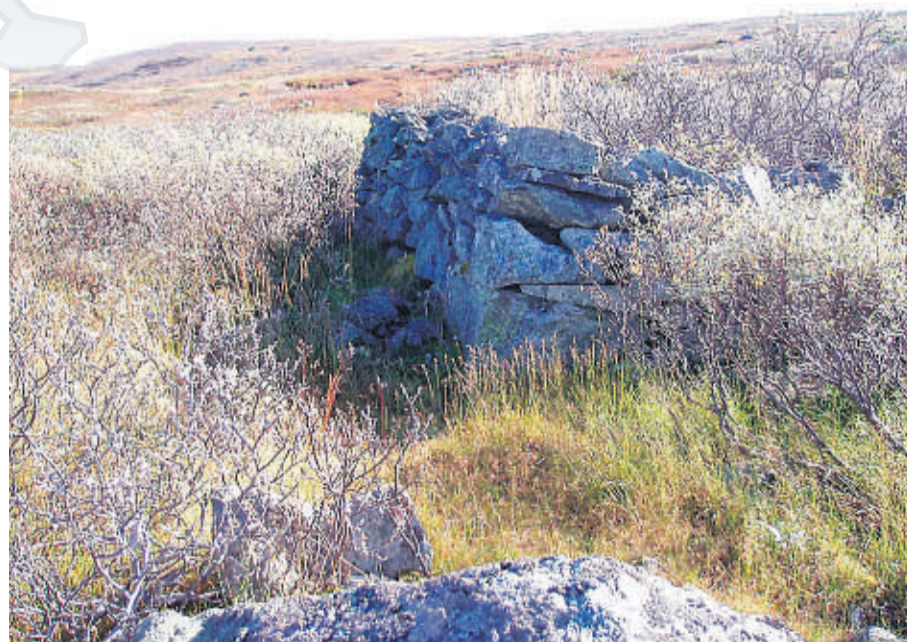
NÆRMER SEG HALLINGDAL: Ruinen av Lakaset viser Usteberget i bakgrunnen.

var hallingens fjell, og dermed kan ha gitt navn til både fjellet og boden, skyldes at hallingene trolig var de første som trengte inn på dette området av Hardangervidda. Det er de topografiske forhold som taler mest for dette. Veivalget på vestsiden var uten tvil det vanskeligste. Det er få steder en kan gå opp på vidda fra vest.