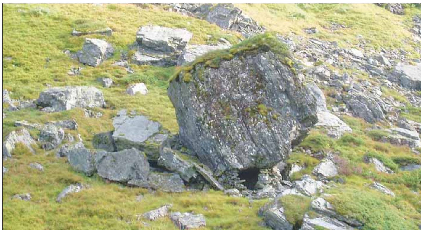
Far etter folk: En heller et sted under Hallingskarvet.

(Svein Indrelid, «Hardangervidda», 1985)